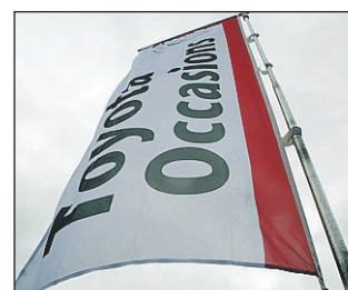
Une centaine de véhicules d'occasion sont en stock

Renseignements : : zone d'activités de Samoreau rue de la Bernache 01.60.71.60.00 www.toyota-fontainebleau.fr