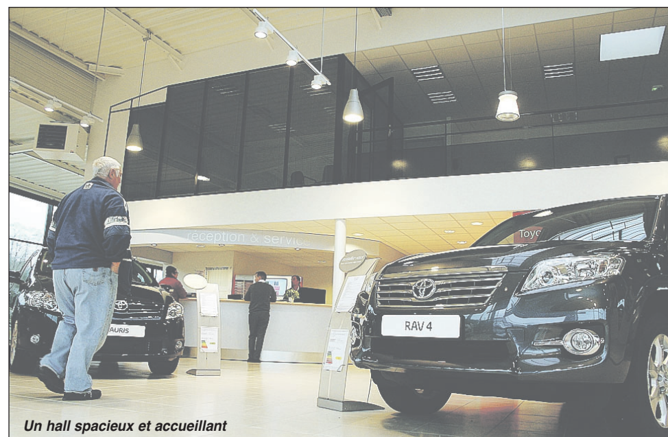
Un hall spacieux et accueillant

De plus, la formule de financement « Les engagements Toyota » reste unique en son genre : elle inclue l'entretien, la garantie et l'assurance du véhicule pendant trois ans.